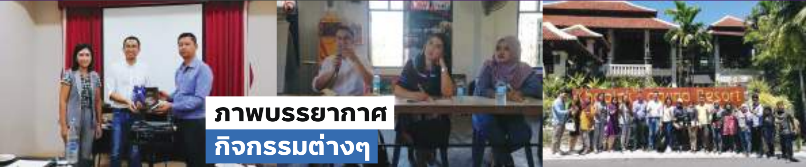
ภาพบรรยากาศ กิจกรรมต่างๆ